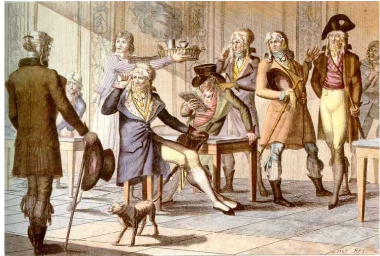
Merveilleuses et Incroyables, BN