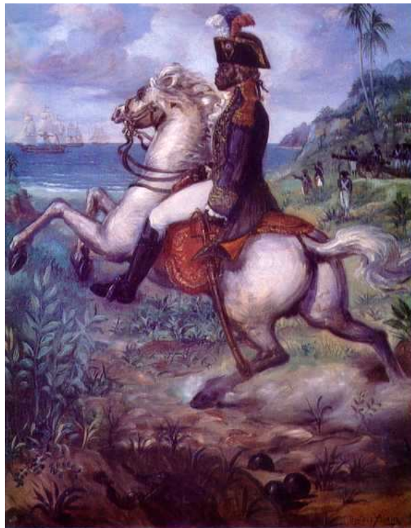
Toussaint Louverture par Gustave Alaux

En 1796, le général Villatte , métis, tenta un coup de force contre Laveaux et sa politique d'alliance avec les nouveaux libres, mais fut battu par Louverture. Laveaux nomma alors Louverture gouverneur de Saint-Domingue , avant de le quitter pour aller défendre la révolution, comme député en France.