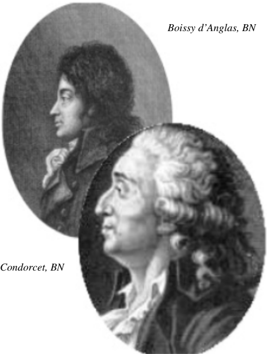
Boissy d'Anglas, BN