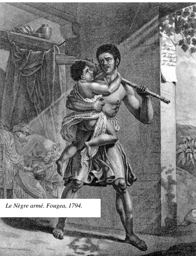
Le Nègre armé. Fougea, 1794.

Assurée de la fougue révolutionnaire des nouveaux libres, la Commission décide de mener une guerre révolutionnaire dans les Petites Antilles :