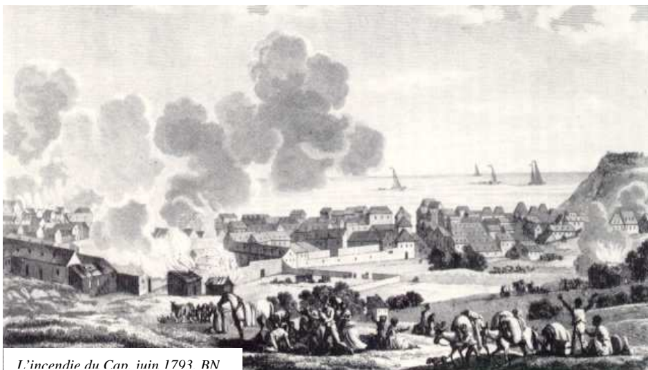
L'incendie du Cap juin 1793 BN

C'était la première ville que les esclaves prenaient depuis 1791. Ils y restèrent et délibérèrent sur les modalités de la liberté générale. Le 24 août, ils portèrent leur décision à Sonthonax qui s'y rallia le 29, suscitant la rupture avec une partie des libres de couleur hostiles à l'abolition.